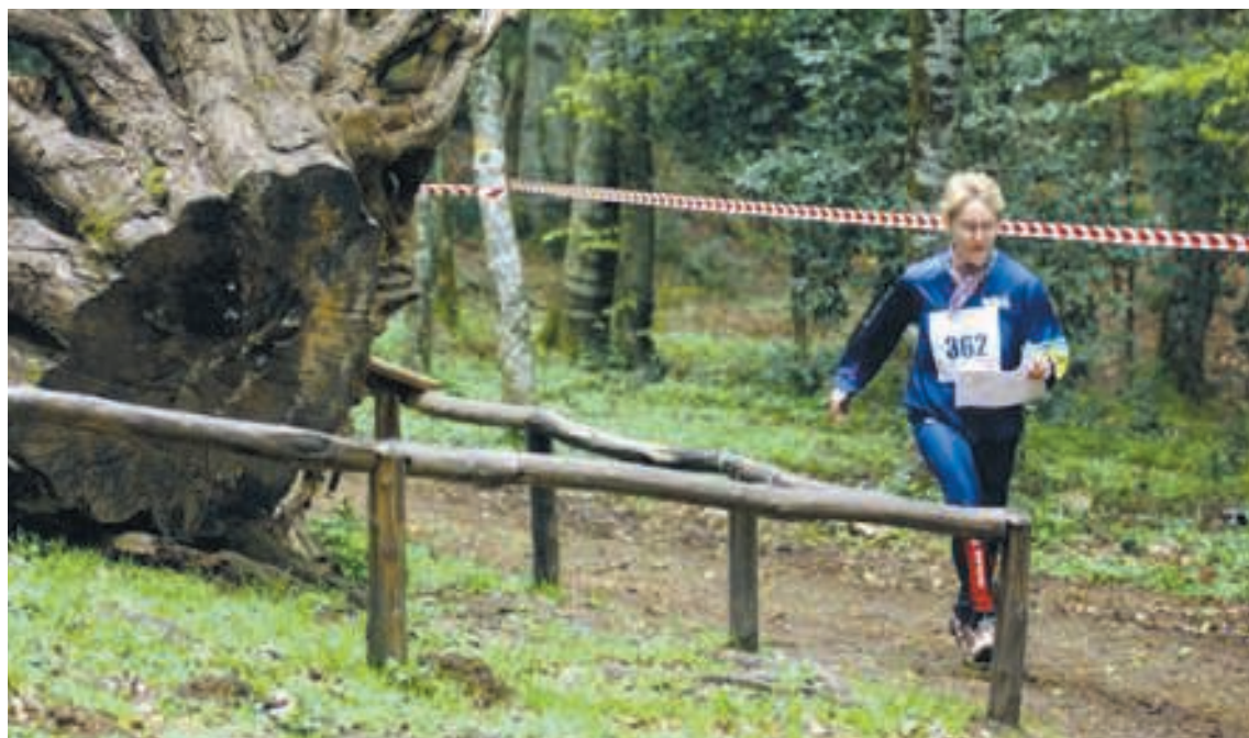
Alcuni atleti durante fasi di gara di Orienteering, ed il logo del mondiale torinese della prossima estate

sport per tutti" in quanto favorisce la pratica dello sport fra le persone mature, nella consapevolezza che gli sport competitivi possono essere praticati ad ogni età, con grandi benefici per la salute.